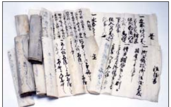
井ノ内地区に伝わる村掟(教育委員会所蔵)

村では儉約を目的とした取り決めがたびたびなされています。節句や農事祝い、冠婚葬祭、履物にいたるまで、日常生活について細かく取り決められていました。これら儉約項目から村の生活のようすがうかがえます。