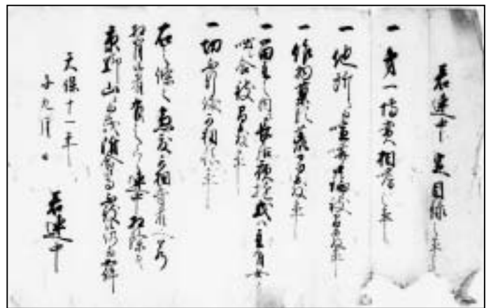
井ノ内村若連中定書(教育委員会所蔵)

天保11(1840)年に定められた井ノ内村若連中定書には、村掟と同じく盗み・博奕を禁止するほか、留守の家に長居してはいけない、主人のある女と話をしてはいけないと定められています。